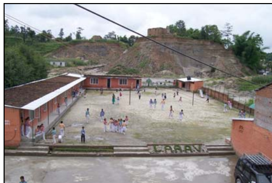
De klaslokalen van de Lovely Angels School