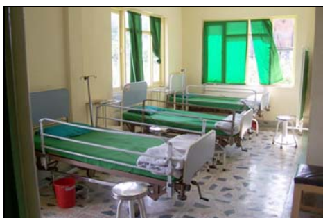
Ziekenzaal in Pharping