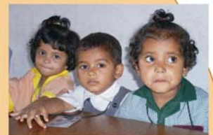
Door Stichting Milan Bindu gesponsorde mensen