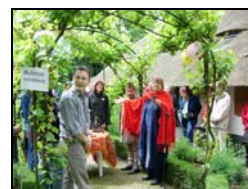
Openingsceremonie op de Nepaldag 2005

Laat u verrassen door het fascinerende maar zeer arme Nepal en kom zondag 11 juni naar de Nepaldag op Daaldersmaat, Doesburgseweg 8 in Loil (bij Didam). Entree voor volwassenen bedraagt € 2,50 en voor kinderen € 1,-