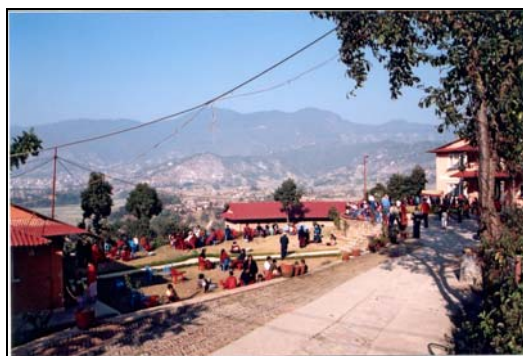
Gebouwencomplex van New Sadle in Kapan