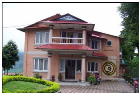
De hoofdingang van New Sadle in Kapan.

In Kapan, ongeveer 10 kilometer vanaf Kathmandu ligt de hoofdvestiging van New Sadle. Van hieruit vindt alle export met het buitenland plaats. De vestiging in Kapan is onder te verdelen in een aantal secties: het hoofdkantoor, het bejaardentehuis, het ziekenhuis voor behandeling van leprawonden, de werkplaatsen, de Lovely Angels School en de kinderdagopvang.