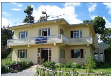
Road Side Clinic in Pharping

Afhankelijk van de financiële mogelijkheden, wordt er een bijdrage voor de medische hulp gevraagd.