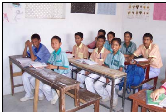
Oudere leerlingen op de Lovely Angels School.