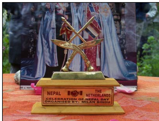
Aandenken geschonken door New Sadle op de Nepaldag 2005. Symboliseert de samenwerking tussen Nepal en Nederland.

Achter de verkoop van de Nepalese producten ligt de visie: Geef de mensen geen vis maar leer ze vissen. En dat werkt in dit project zeer goed. Een andere manier om dit project een eerlijke kans te geven is door producten te kopen die Tilingo-Neptra aan de Wereldwinkels in Nederland verkoopt. Tilingo-Neptra heeft een uitgebreid aanbod van artikelen waaruit o.a. prachtige relatiegeschenken of kerstpakketten zijn samen te stellen.