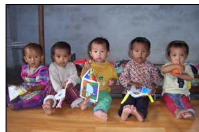
kinderen van de kinderdagopvang