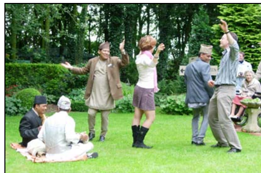
dansen op de Nepaldag