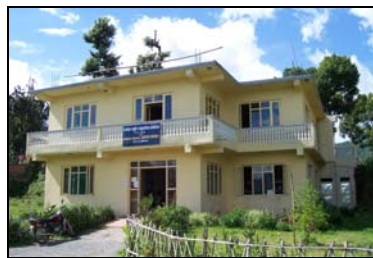
twee verdiepingen zijn klaar in de clinic in Parphing