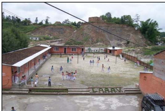
de klaslokalen van de Lovely Angels School