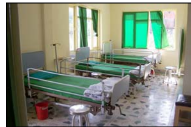
ziekenzaal in Parphing