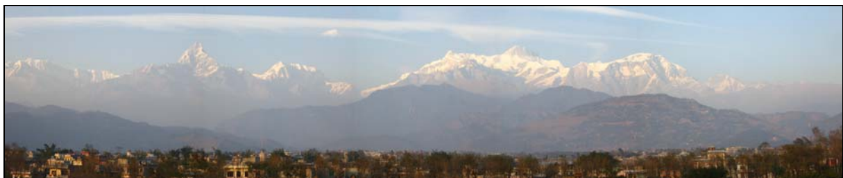
uitzicht op de Himalaya