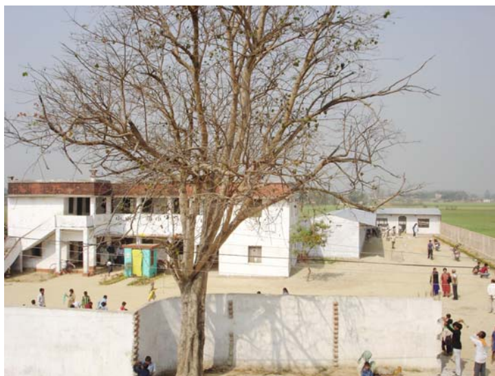
nieuw gebouwde school in Kalaiya

Op dit moment krijgen 600 kinderen onderwijs. De school groeit enorm en is eigenlijk alweer te klein. Dit alles met dank aan de donateurs en de medewerkers van de Wereldwinkel Oirschot. Hiermee geven zij deze kinderen een toekomst.