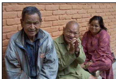
drie bejaarde ex-leprapatiënten