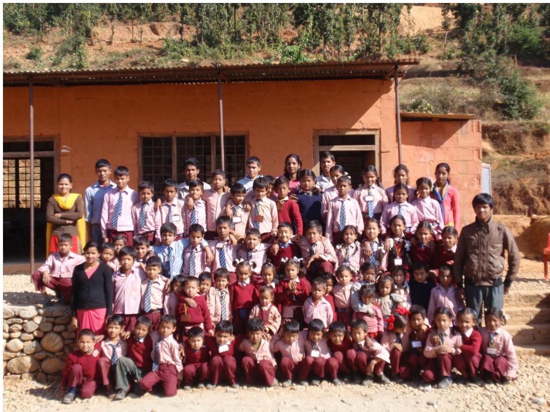
Kinderen en docenten van de school in Dhandkhola

Met de giften van de Zusters van Oirschot is er verder aan de school in Dhankhola gebouwd. De muren hebben een verfje gekregen en ook de omgeving van de school ziet er netjes uit. Op dit moment beraadt de schoolleiding zich over de aanleg van een speelplaats. De andere helft van het geschonken geld wordt gebruikt om de docenten van de LAS te trainen om de kwaliteit van lesgeven te verbeteren. Er gaan twee leerkrachten één jaar lang wekelijks één dag naar de organisatie ECEC (Early Childhood Education Centre) en zes docenten krijgen hier gedurende drie maanden een dag in de week een training. Als deze studie is afgerond, is het de bedoeling dat zij hun kennis weer overdragen aan de andere docenten.